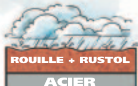
Rouille stabilisée avec du RUSTOL-OWATROL®

Notre "Département technique" est là pour répondre à toutes vos questions. Nous vous invitons donc à le joindre au 01 60 86 48 70 ou à consulter notre site.