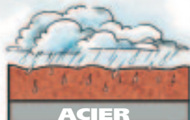
Rouille non traitée