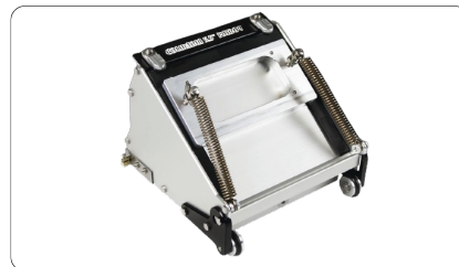
3740 - Boite de finition automatique