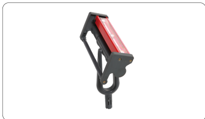
1378 - Lampe rasante sans fil