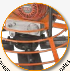
Anneaux de protection des pales..