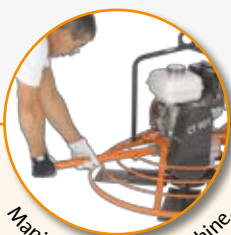
Manipulation de la machine.