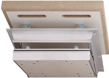
Trappe pour le faux plafond