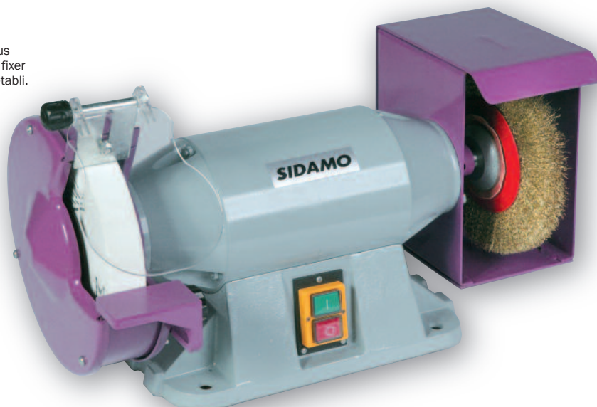
TM 200 B TM 200 BT

✓ Conseils d'utilisation : Par mesure de sécurité, nous vous rappelons qu'il est obligatoire de fixer le touret sur un socle ou sur un établi.