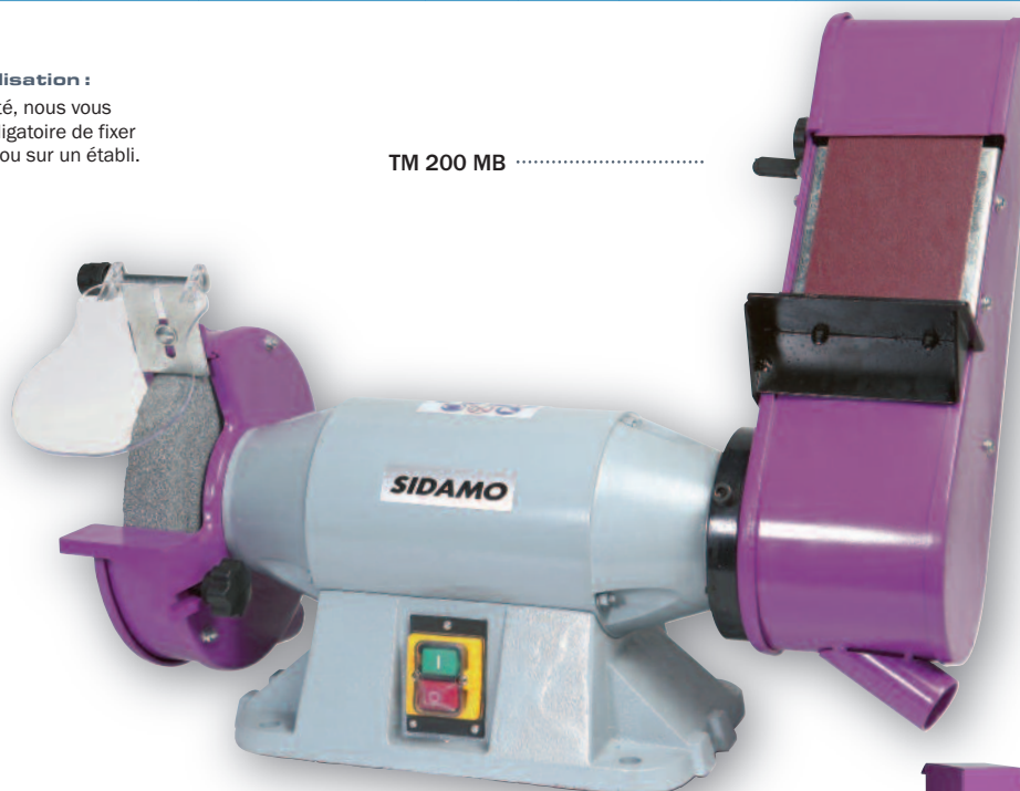
TM 200 MB .....

Par mesure de sécurité, nous vous rappelons qu'il est obligatoire de fixer le touret sur un socle ou sur un établi.