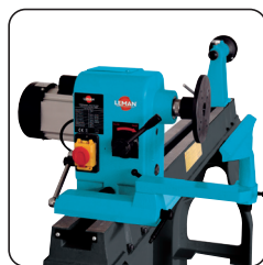
Rotation de la tête jusqu'à 180°