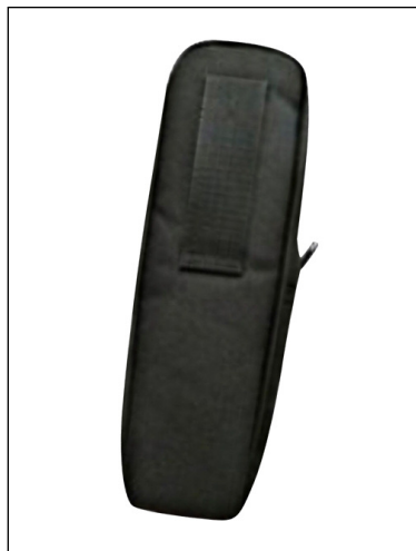
SC518: Sacoche de protection