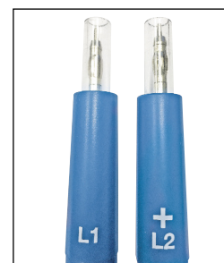
Pointes de touche IP2X