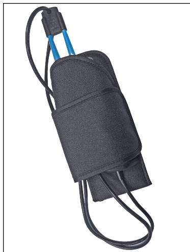
SC523: Etui ceinture