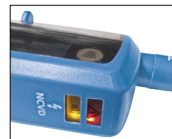
Double diode de sécurité et continuité