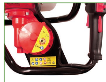
Embrayage centrifuge avec système de décompression