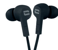
ÉCOUTEURS ÉTANCHES IPX6