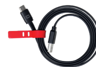
CABLE USB-A / USB-C