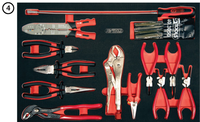
Pincés-étaux-multiprises-Circlips® Ciseau, Aimant, Limes

Photos et documents non contractuels. Toute omission, toute erreur typographique, toute modification de produit ne saurait engager la responsabilité de KS Tools SAS. Prix nets hors taxes conseillés, réservés aux professionnels. Offres établies selon nos conditions générales de ventes. * Dans la limite du stock disponible. KS TOOLS - RC B 411 276 017 // Conception - Février 2024 // NE PAS JETER SUR LA VOIE PUBLIQUE.