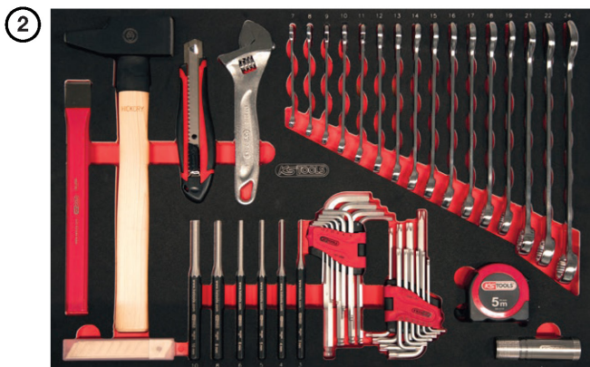
Clés mixtes 7 à 24 mm - Outils de frappe Outils de coupe - Chasses-goupilles 3 à 10 mm Lampe torche - Clé à molette - Clés mâles