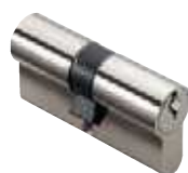
Cylindres panneton rayon 11,4 mm (PM2) p. 28