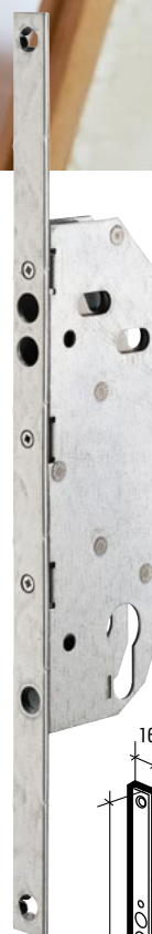
Axe à 40 mm Réf. : 013994

Réf. 097035 Réf. 013959 Réf. 097007 Réf. 013957 Réf. 097002