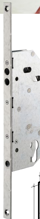
Axe à 50 mm Réf. : 013995