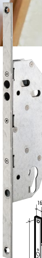
Axe à 40 mm Réf. : 013994