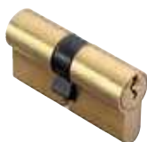
Cylindres p. 56