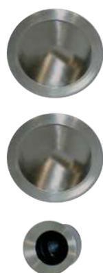
Bec de cane