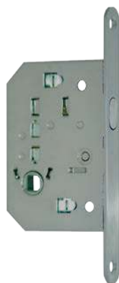
Condamnation pour portes de 40mm