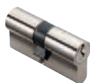
Cylindres panneton spécial rayon 13,6 mm (PM1) p. 54