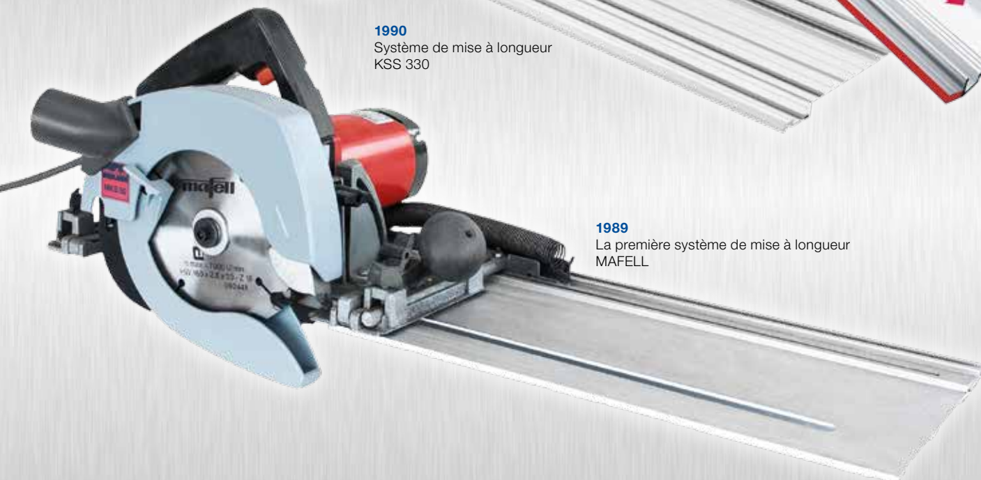
1989 La première système de mise à longueur MAFELL

Qui a une fois travaillé avec une scie à règle de guidage MAFELL se rend vite compte que l'on ne peut plus se passer de la KSS au quotidien. Un outil qui ne changera pas seulement votre travail, mais aussi vous-même. Voyez vous-même et suivez votre instinct.