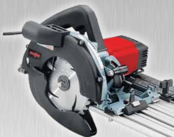
1990 Système de mise à longueur KSS 330