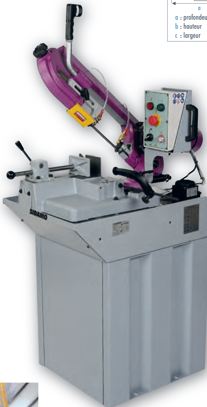
SR 170 MV .....

Détendre le ruban en fin de journée. Afin d'obtenir une excellente finition de coupe et une grande longévité du ruban, il est impératif de choisir la denture du ruban, d'adapter la vitesse de descente de l'archet et la vitesse du moteur en fonction du profil de la pièce à couper.