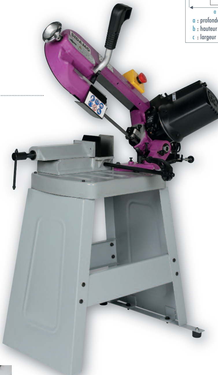
SR 125 MV .....

Détendre le ruban en fin de journée. Afin d'obtenir une excellente finition de coupe et une grande longévité du ruban, il est impératif de choisir la denture du ruban, d'adapter la vitesse de descente de l'archet et la vitesse du moteur en fonction du profil de la pièce à couper.