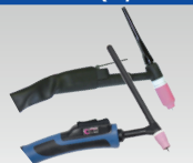
Torche TIG - 8 m SR26L SR26DB 046184 046177