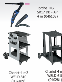
Chariot 4 m2 WELD 810 (037489)