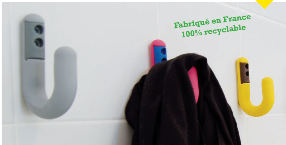
Le PORTEMANTEAU PARKID BY WATTELEZ est composé d'une patère souple (A) et d'une pièce de fixation rigide (B). Il se fixe grâce à 2 vis.