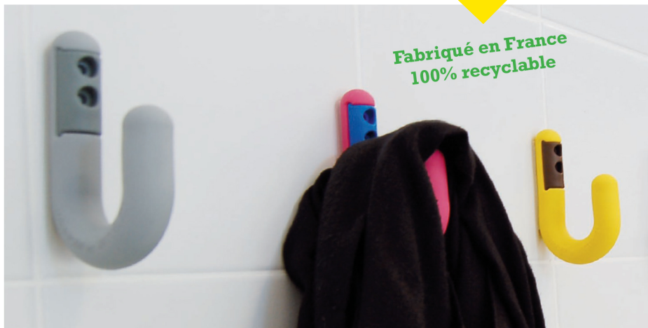
Le PORTEMANTEAU PARKID BY WATTELEZ est composé d'une patère souple (A) et d'une pièce de fixation rigide (B). Il se fixe grâce à 2 vis.