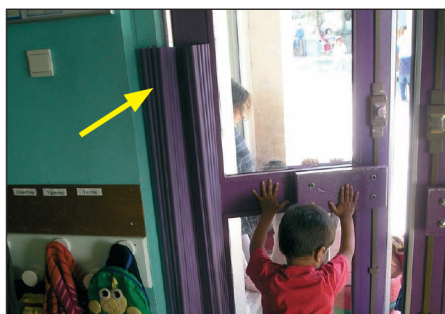
Anti pince-doigts GAROMIN en page 134