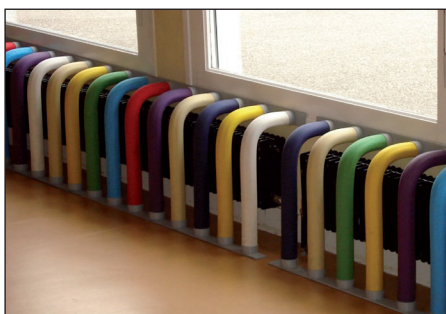
Protège radiateur PARKID en page 150