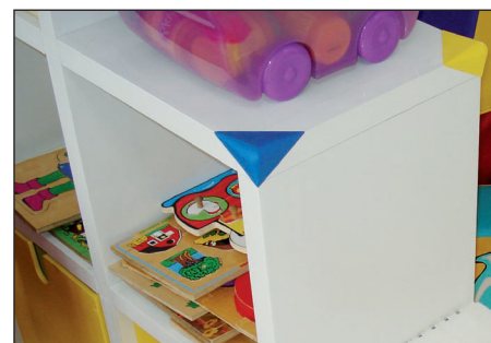
Coins ANGLISOL en page 83