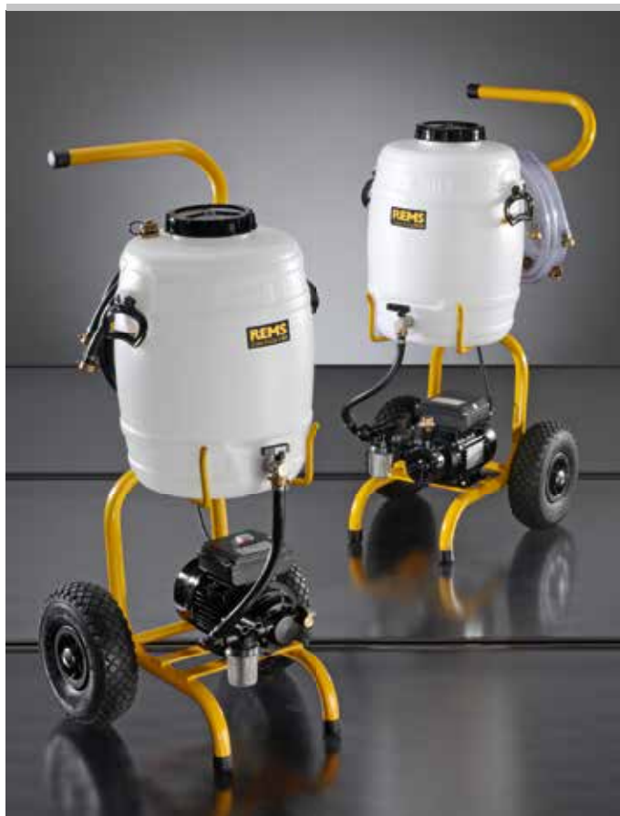
Produit allemand de qualité

Robinet d'arrêt pour la fermeture du tuyau de refoulement ou du tuyau de retour, par ex. lors du transport. Filtre fin avec sac filtrant fin 70 µm, composé d'un couvercle à visser avec raccordement pour tuyau de retour avec raccord 3/4", adaptateur et sac filtrant fin 70 µm, ou filtre fin externe avec élément filtrant 90 µm, lavable à l'eau, avec grand réservoir de collecte de saletés pour conduite de retour avec raccord 3/4" pour rincer les chauffages au sol/muraux et éliminer la boue. Vanne d'inversion de flux complète avec tuyau armé textile EPDM 1/2" T100, pour rincer les chauffages au sol/muraux et éliminer la boue de manière efficace grâce aux coups de bélier provoqués par le changement du sens de flux. Vannes 3 voies pour aspiration du fluide depuis un autre réservoir, par ex. pour grands volumes.