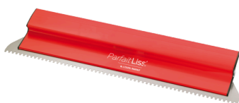
7541 - Couteau I.T.E ParfaitLiss'®