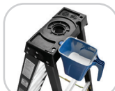
Mini bac 382200 27.50 € HT