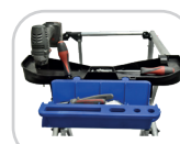
Multicases 382202 36.00 € HT