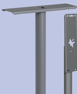
U 800 Piquet Brabantia