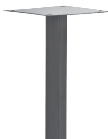
Piquet Securi-Box Acier 60 x 30 x 1200 mm ép. 20/10° avec platine fixe soudée en tôle d'acier 200 x 200 x 2 mm