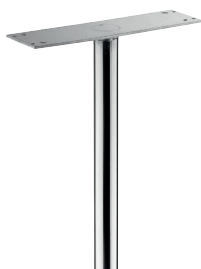
Piquet Securi-Box Inox ø 45 x H 1500 mm avec platine soudée