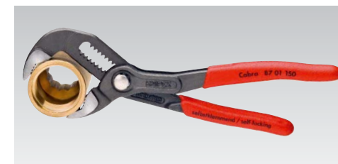
Mini Cobra: En format de poche avec toutes les fonctions de la Cobra. Capacité jusqu'à Ø 30 mm