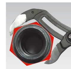
Cobra XL (longueur 400 mm) dépasse grâce à l'ouverture de ses mâchoires jusqu'à 95 mm l'efficacité d'une clé serre-tubes de la même longueur