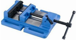
Etau à serrage rapide 156mm – réf 2022