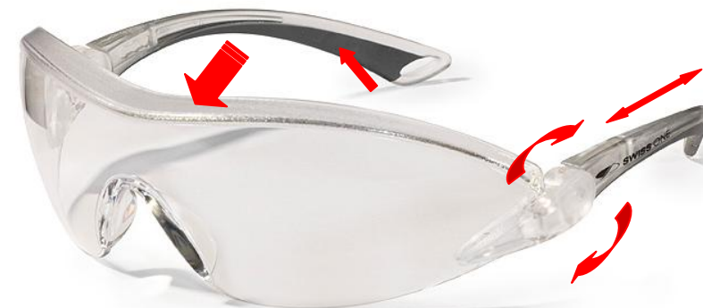
Incolore 1FAL 23C