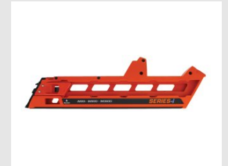
Eurocode 013225 Ensemble magasin long IM90i / Ci