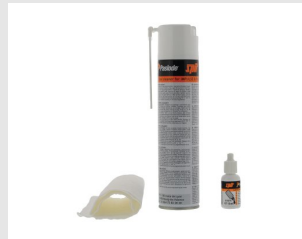
Eurocode 013690 Kit de nettoyage IMPULSE / PULSA