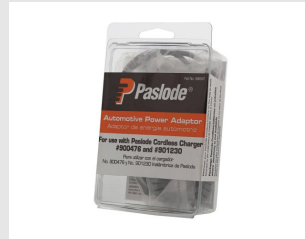
Eurocode 900507 Adaptateur de voiture