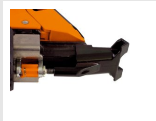
Eurocode 013221 Ensemble palpeur languette IM90i / Ci