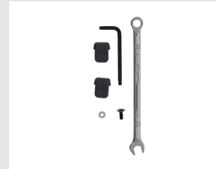
Eurocode 013256 Ensemble embout palpeur bard. IM90i / Ci