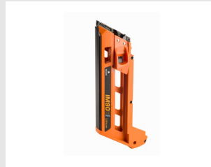
Eurocode 013224 Ensemble magasin STD IM90i / Ci