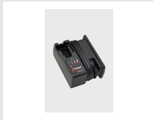
Eurocode 018881 Chargeur de batterie IMPULSE Lithium