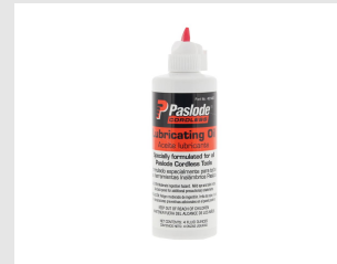
Eurocode 401482 Huile IMPULSE