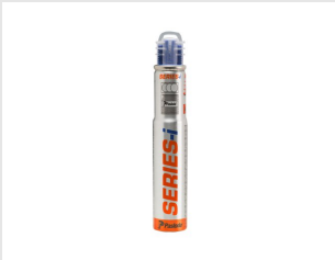
Eurocode 300348 Blister 1 cartouche IM90i / Ci