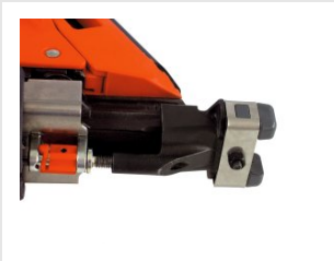
Eurocode 013211 Ensemble palpeur bardage IM90i / Ci