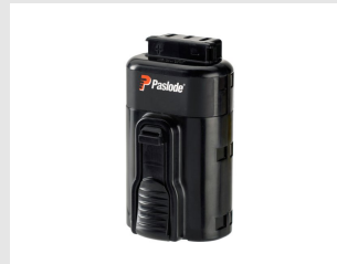
Eurocode 018880 Batterie IMPULSE Lithium