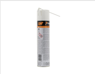
Eurocode 115251 Nettoyant IMPULSE & PULSA 300 ml