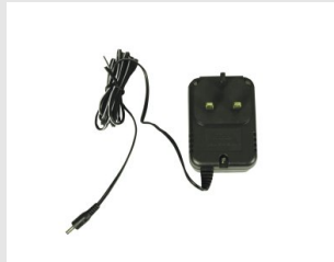
Eurocode 900505 Adaptateur secteur 220v / 12V