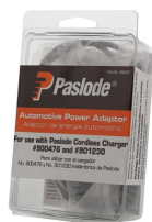
Eurocode 900507 Adaptateur de voiture