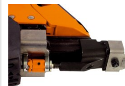
Eurocode 013223 Ensemble palpeur polytuile IM90i / Ci