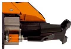
Eurocode 013221 Ensemble palpeur languette IM90i / Ci