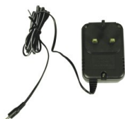
Eurocode 900505 Adaptateur secteur 220v / 12V