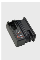
Eurocode 018881 Chargeur de batterie IMPULSE Lithium