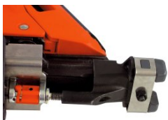
Eurocode 013211 Ensemble palpeur bardage IM90i / Ci