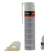
Eurocode 013690 Kit de nettoyage IMPULSE / PULSA