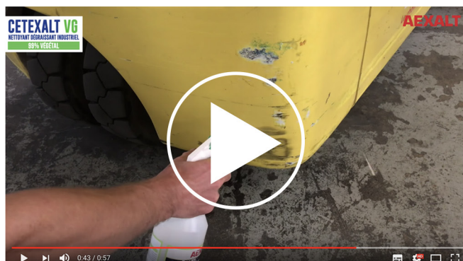
CETEXALT VG - Dégraissant industriel polyvalent concentré 99% végétal

Notre environnement c'est vous ! Visionnez la vidéo de présentation : www.youtube.com/watch?v=fbpxUvFRx6k