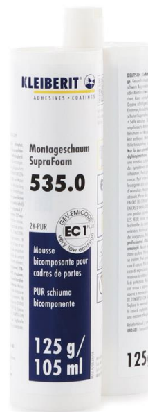
KLEIBERIT 535.0 SupraFoam en cartouche à double cylindre