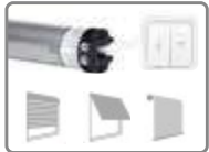
Moteur ø 35mm, avec fins de courses mécaniques