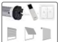
Moteur Radio ø 45mm, avec fins de courses mécaniques