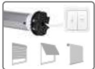
Moteur ø 45mm, avec fins de courses mécaniques