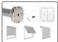
Moteur ø 45mm, avec fins de courses mécaniques avec manivelle de secours