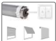
Moteur ø 58mm, avec fins de courses mécaniques