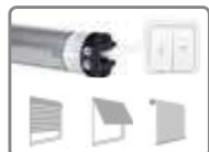
Moteur ø 35mm, avec fins de courses mécaniques