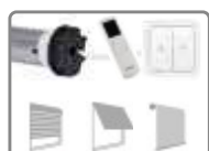
Moteur Radio ø 45mm, avec fins de courses mécaniques