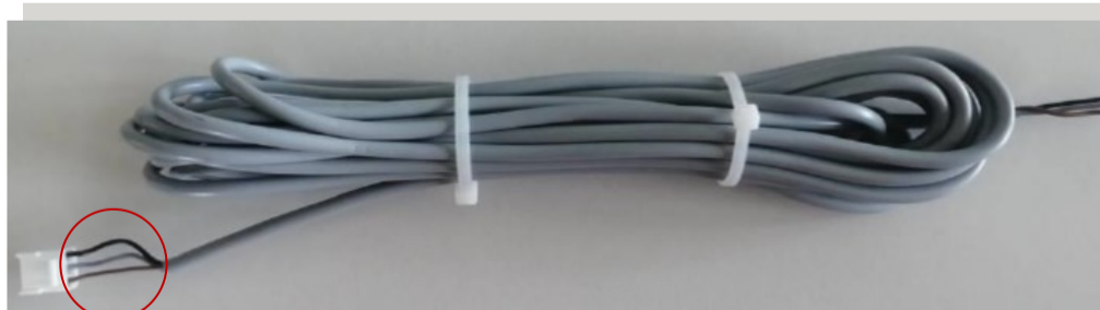
Nouveau câble de connexion temporaire