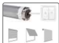
Moteur ø 58mm, avec fins de courses mécaniques