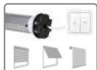
Moteur ø 45mm, avec fins de courses mécaniques