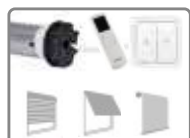
Moteur Radio ø 45mm, avec fins de courses mécaniques