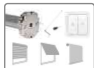
Moteur ø 45mm, avec fins de courses mécaniques avec manivelle de secours