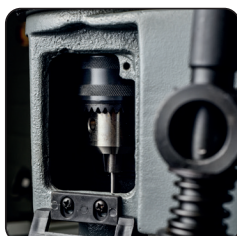
Système de mandrin pour fixation de la mèche