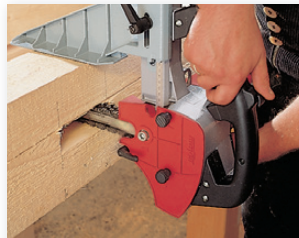
La LS 103 Ec pour des travaux horizontaux.