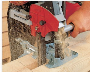
La LS 103 Ec et le support de guidage FG 150 pour des profondeurs de mortaises pouvant atteindre 140 mm.