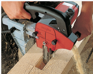
Mortaises de différentes tailles (jusqu'à 100 mm) réalisées avec la LS 103 Ec.