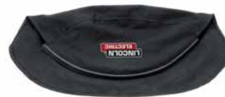
PROTECTION EN COTON IGNIFUGÉ

Protection de tête LINCOLN ELECTRIC en coton ignifugé avec contour en silicone Press Fit