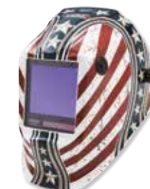
VIKING™ 3350 Daredevil™