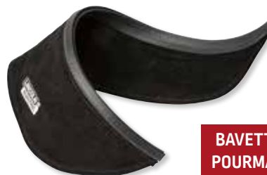
BAVETTE CROÛTE DE CUIR POUR MASQUE DE SOUDAGE