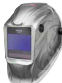
VIKING™ Heavy Metal®

Performances extérieures supérieures pour une utilisation dans tous les environnements