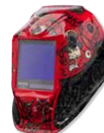
VIKING™ 3350 Mojo™