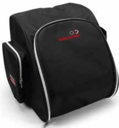
SAC À DOS POUR MASQUE