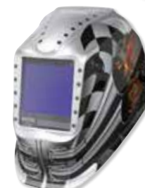
VIKING™ 3350 Motorhead™