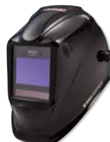
VIKING™ 2450 Black

CE QUI EST INCLUS: Livré avec sac de rangement, Bandana, 5 écrans de protection extérieurs, 2 écrans de protection intérieurs et une planche de stickers de personnalisation.