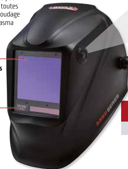
VIKING™ 3350 BlackMat