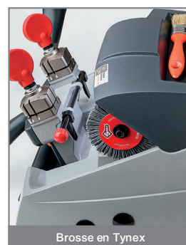
Brosse en Tynex

La brosse servant à éliminer les bavures de la clé après le taillage est en Tynex pour assurer un brossage uniforme et une clé parfaitement finie.