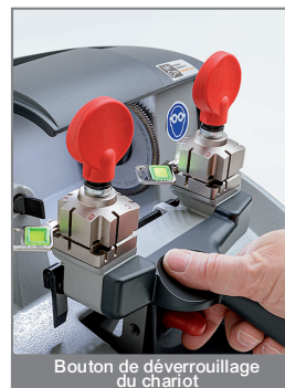
Bouton de déverrouillage du chariot

Pour plus de sécurité, le moteur de la fraise ne fonctionne que pendant l'opération de taillage. Il démarre automatiquement lorsque le levier du chariot est relevé et s'arrête automatiquement lorsque ce levier est