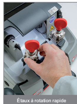
Étaux à rotation rapide

relâché. Il n'est pas nécessaire d'appuyer sur le bouton marche/arrêt et aucun risque que la fraise reste accidentellement allumée.