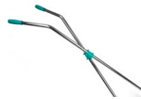
Manche pour balai ciseaux renforcé