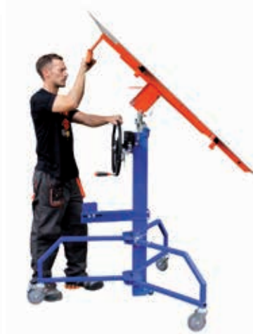
POSE SOUS PENTE