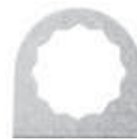
Porte-outil FEIN SUPERCUT bihexagonal, adapté à tous les FEIN SUPERCUT FSC 2.0 (Q), FSC 1.6 (Q), (A)FSC 1.7 (Q), AFSC 18