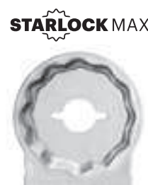
STARLOCK MAX Porte-outil StarlockMax, adapté à tous les outils polyvalents avec fixation adaptée. Avec adaptateur, également adapté à tous les outils FEIN SUPERCUT avant 04/16.