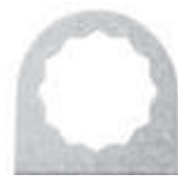
Porte-outil FEIN SUPERCUT bihexagonal, adapté à tous les FEIN SUPERCUT FSC 2.0 (Q), FSC 1.6 (Q), (A)FSC 1.7 (Q), AFSC 18