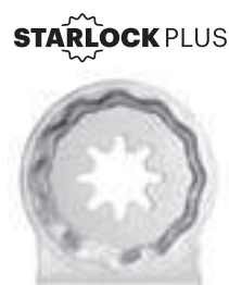
STARLOCK PLUS Porte-outil StarlockPlus, adapté à tous les outils polyvalents courants avec fixation StarlockPlus et StarlockMax ainsi que pour tous les outils FEIN MULTITALENT et MULTIMASTER jusqu'à 04/16.