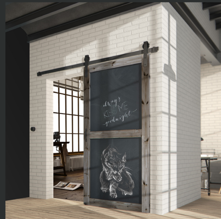
Système ROC®- DESIGN