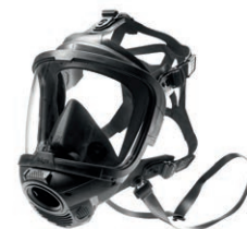
Dräger X-plore® 8000 casque avec visière