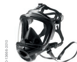
Dräger X-plore® 8000 casque avec visière