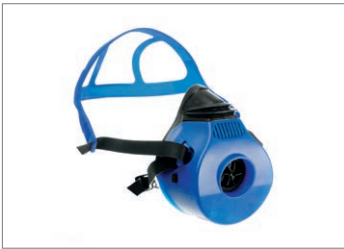
Dräger X-plore® 4740, silicone

La famille Dräger X-plore 4700 est un demi-masque robuste et durable conçu pour résister aux conditions les plus difficiles. Il est aussi équipé d'un jeu de brides Flexifit pour une pose et un retrait faciles ainsi que pour une tenue confortable.