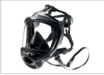
Dräger FPS® 7000, masque complet

Les masques Dräger X-plore 6300, 6530, 6570 et Dräger FPS 7000 définissent de nouveaux standards de sécurité et de confort. Ces masques complets vous apportent le plus haut niveau de protection (TM3) basé sur une étanchéité fiable grâce à un joint double qui s'adapte au visage.